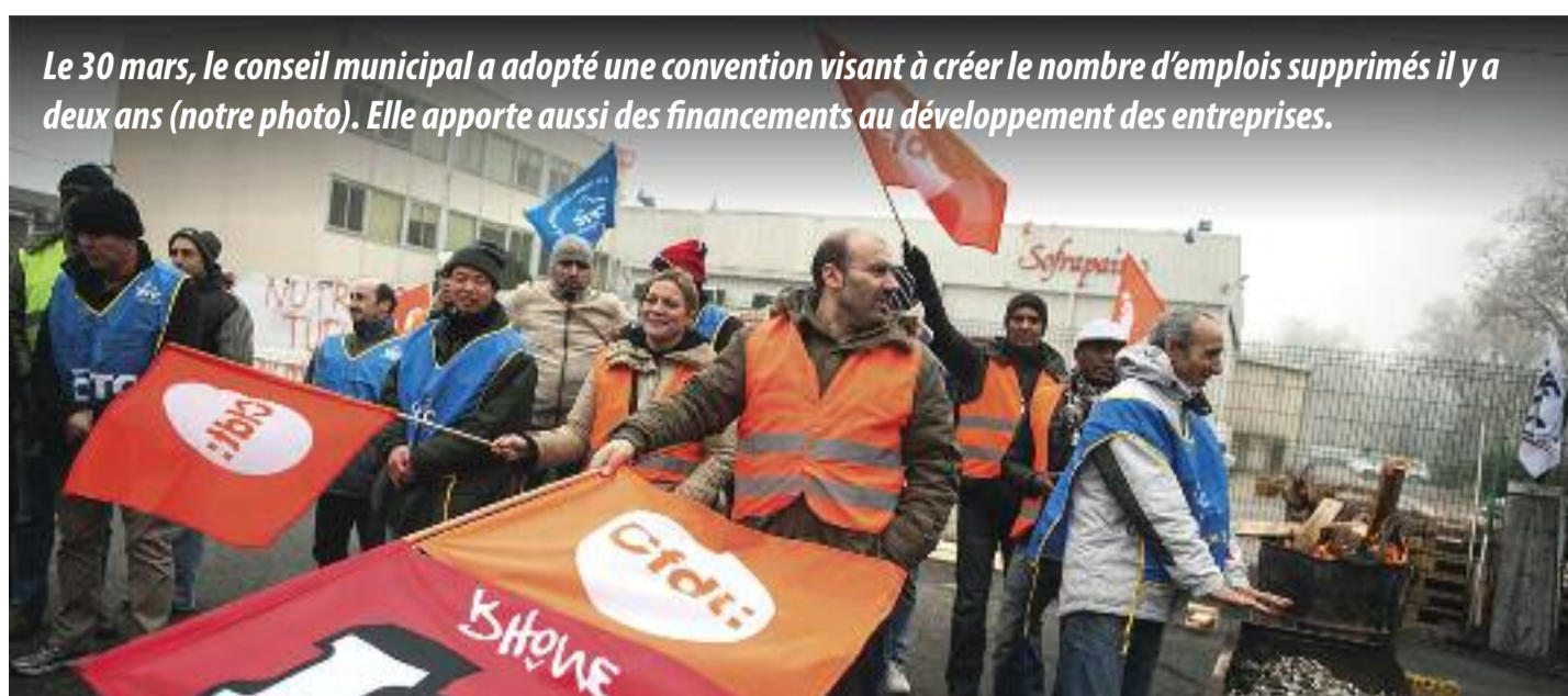
Le 30 mars, le conseil municipal a adopté une convention visant à créer le nombre d'emplois supprimés il y a deux ans (notre photo). Elle apporte aussi des financements au développement des entreprises.

La convention prévoit ensuite le soutien des PME et TPE en matière de formation et de développement économique et commercial mis en oeuvre par Agefos PME, avec un objectif de 28 entreprises accompagnées. Mon-