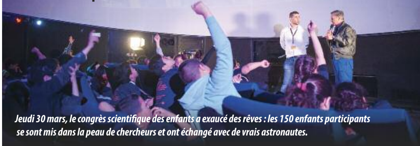
Jeudi 30 mars, le congrès scientifique des enfants a exaucé des rêves : les 150 enfants participants se sont mis dans la peau de chercheurs et ont échangé avec de vrais astronautes.